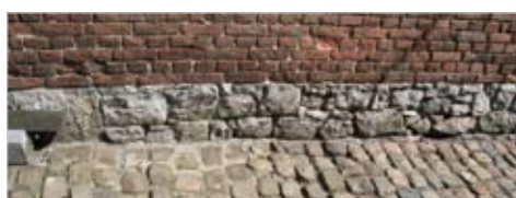
Trottoir pavé à Gerpinnes.

Les clôtures contribuent à distinguer l'espace public et l'espace privatif. Le centre de Gerpinnes est riche d'un dense réseau de murets en pierre. A découvrir en parcourant la balade «Retour aux Sources».