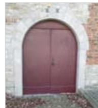
En plein cintre