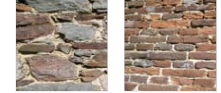
Grès à Joncret Brique