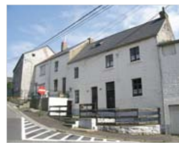
Gerpennes. Alignement de maisons épousant le relief du sol.

En Condroz, les maisons sont généralement construites parallèlement à la voirie. Elles sont souvent mitoyennes mais elles sont parfois construites en fond de parcelle ménageant alors une cour entre la rue et la façade.