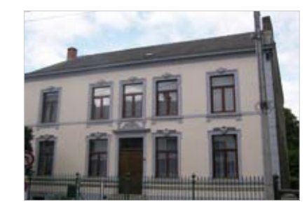
Maison enduite à Gerpennes.

Le sablage systématique des façades a des répercussions importantes sur la silhouette villageoise. Il assombrit le village et ses rues en leur donnant une image plus austère. De plus, il met en évidence la mauvaise qualité de certaines pierres et les disparités dans la mise en œuvre des matériaux, notamment les retouches et agrandissements.