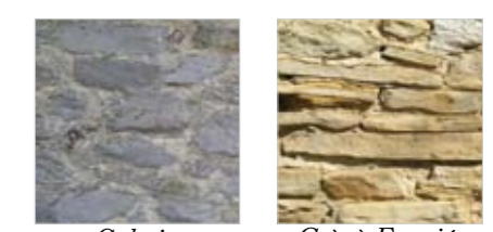
Calcaire Grès à Fromièe

Préférez la chaux naturelle au ciment. Perméable à la vapeur d'eau (contrairement au ciment), la chaux permet au bâtiment de «respirer».