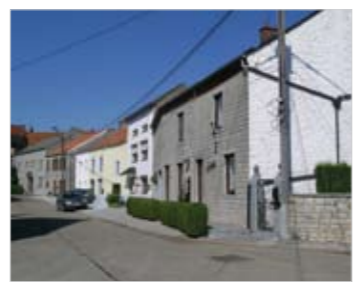
Hymiee. La mitoyenneté s'est développée au 19 ème siècle avec l'essor des villages.