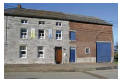
Ferme tricellulaire à Joncret

petite étable sous fenil. La grange (stockage du grain) n'est pas indispensable lorsque l'agriculture n'est pas la principale occupation.