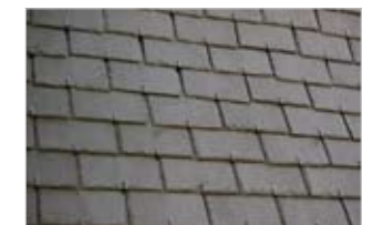
Pour les toitures, l'ardoise et la tuile dite en «S» traditionnellement utilisées.