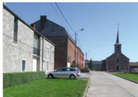
Abords de ferme à Hymiée

Fermes et maisons sont souvent bordées par une bande de terrain de largeur variable qui, par le passé, était souvent laissée en herbe ou parfois pavée. Ces espaces ont tendance à évoluer, chacun aménageant ces abords selon ses goûts.