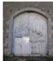
En anse de panier